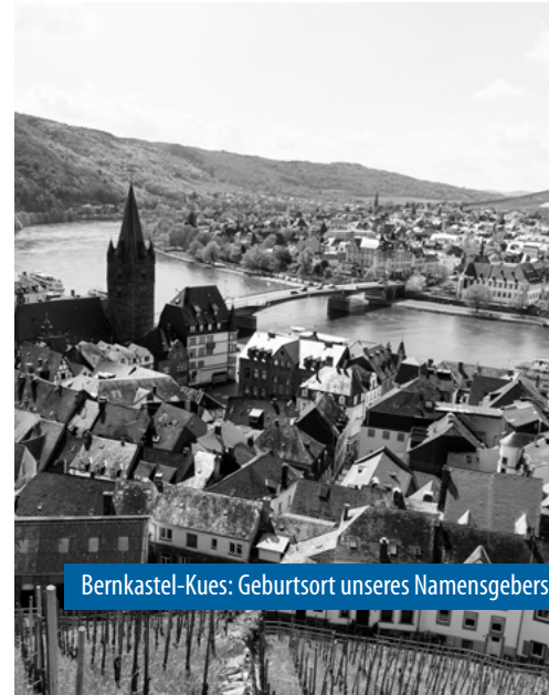
Bernkastel-Kues: Geburtsort unseres Namensgebers