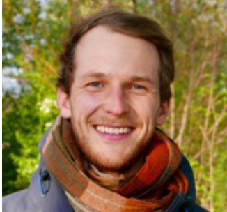
by Lorenz Ottilinger

„Das Institut für Ökonomie an der Cusanus Hochschule steht für mich für eine herausragende und inspirierende Lehre, die dazu ermutigt, Ökonomie sowohl in der Theorie zu entwickeln als auch in der Praxis zu gestalten. Schon während des Masterstudiums habe ich meine Berufung in der ethischen Weiterbildung für Entscheidungsträger gefunden und verantworte in Freiburg einen Zertifikatsstudiengang.“