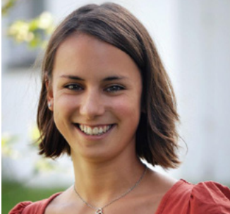
by Hannah Heller

„Nach den zwei Jahren Studium kann ich mich mit einer fundierten und reflektierten Meinung in der Welt positionieren und mich den Problemen stellen, ohne an dem Leid in der Welt zu verzweifeln. Ich habe während meines Studiums meine eigene regionale Initiative gegründet und bereite mich nun auf die Promotion vor.“